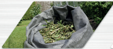
Material triturado usado em compostagens