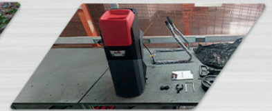
Tanque recolhedor de detritos de 40 litros