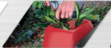
Tritura galhos de até 40 mm