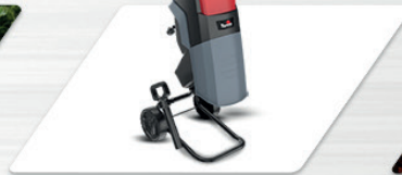
Rodas para facilitar o transporte